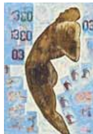
MAOUAL Bouchaib, Tétanos, 2009, technique mixte sur toile, 100*69 cm

En partenariat avec l'Institut Français et l'Ecole Jean-Jacques Rousseau de Meknès, Société Générale Maroc a organisé l'exposition « Corps - Un choix de la Collection Société Générale » inspirée par l'exposition à succès « Corps et figures du corps » qui s'était déroulée à l'Espace d'Art Société Générale entre décembre 2009 et mai 2010. Cette nouvelle exposition s'est tenue du 28 Mars au 08 Avril 2011 à l'Institut Français de Meknès.